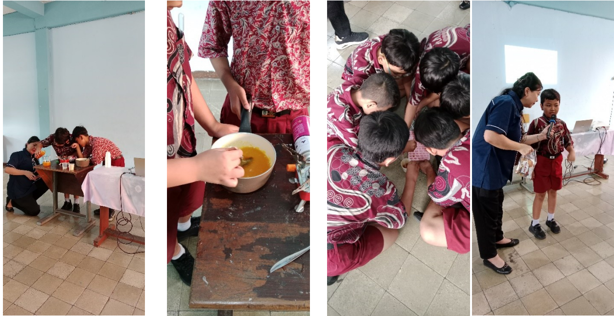
Gambar 4,5,6 dan 7 Proses Kegiatan Praktik Membuat Permen Jelly

Selain aspek literasi kesehatan, kegiatan ini juga diarahkan untuk menumbuhkan minat kewirausahaan sejak usia dini. Peserta diperkenalkan pada konsep sederhana kewirausahaan dengan menekankan bahwa produk permen jelly herbal memiliki nilai jual dan peluang pengembangan sebagai usaha kreatif berbasis bahan lokal.