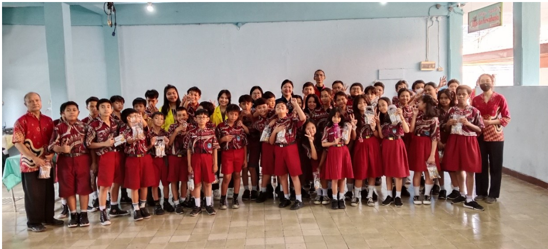
Gambar 7. Peserta Program Pengabdian kepada Masyarakat

Meskipun hasil kegiatan menunjukkan respon yang sangat baik, beberapa keterbatasan perlu dicermati secara kritis. Pertama, indikator keberhasilan masih berfokus pada tingkat pemahaman dan minat peserta, sehingga belum mampu menggambarkan perubahan perilaku jangka panjang. Minat kewirausahaan yang teridentifikasi masih bersifat awal dan konseptual, serta belum diikuti dengan penguasaan keterampilan kewirausahaan yang lebih kompleks, seperti pengemasan produk, pemasaran, dan pengelolaan keuangan sederhana. Kedua, keterbatasan waktu dan fasilitas menyebabkan tidak seluruh peserta memperoleh kesempatan praktik yang setara pada setiap tahapan produksi. Kondisi ini berpotensi mempengaruhi kedalaman pengalaman belajar yang diperoleh masing-masing peserta.