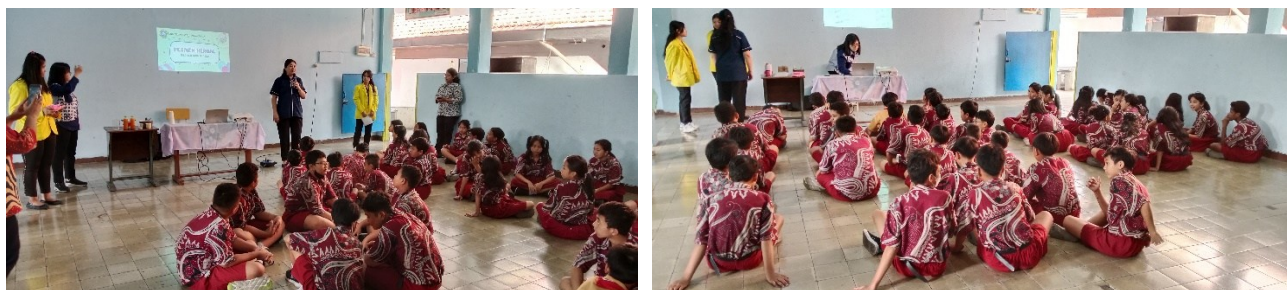
Gambar 2 dan 3 Pembelajaran terkait Tanaman Herbal dan Manfaatnya

Materi selanjutnya berfokus pada manfaat tanaman herbal bagi kesehatan, seperti dukungan terhadap sistem pencernaan, peningkatan daya tahan tubuh, dan pemeliharaan kebugaran fisik. Penyampaian materi tersebut memperkuat pemahaman peserta bahwa bahan alami memiliki fungsi kesehatan yang nyata dan relevan dengan kehidupan sehari-hari (Kumontoy et al., 2023). Pembelajaran kemudian diarahkan pada relasi antara kesehatan dan kearifan lokal. Penggunaan kunyit dan asam sebagai bahan dasar permen jelly dijelaskan sebagai bentuk pemanfaatan bahan lokal yang telah lama dikenal dalam tradisi pengobatan masyarakat Indonesia. Pendekatan ini menempatkan tanaman herbal tidak hanya sebagai bahan kesehatan, tetapi juga sebagai representasi identitas budaya dan pengetahuan lokal yang memiliki nilai strategis untuk dilestarikan (Suliasih & Mun'im, 2022).