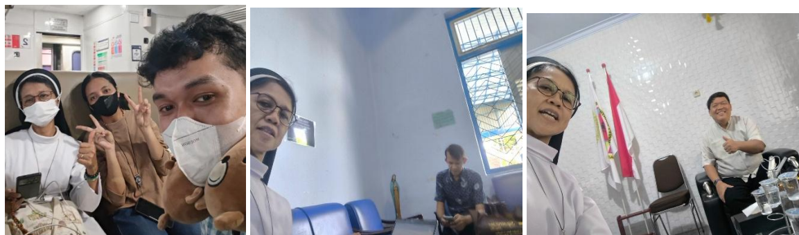
Gambar 2,3,4. Survei Lokasi Pengabdian kepada Masyarakat