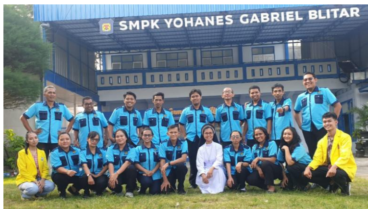
Gambar 12. Peserta Pelatihan SMPK Yoga Blitar.

Evaluasi kegiatan dilaksanakan melalui survei kuesioner yang diberikan kepada para peserta. Dari analisis evaluasi ditemukan sebanyak 95% pendidik dan tenaga kependidikan SMPK Yoga Blitar telah memahami dan hafat nilai-nilai SYPG. Seluruh pendidik dan tenaga kependidikan SMPK Yoga Blitar memaknai pekerjaan sebagai panggilan. Makna bekerja bukan semata-mata demi uang atau penghasilan. Pada kenyataannya, hidup memerlukan uang. Uang merupakan salah satu berkat Tuhan yang dapat diusakan melalui berbagai cara. Sebagai pribadi beriman dan bersemangat SYGP maka senantiasa percaya bahwa Tuhan menyelenggarakan hidupnya, memelihara, dan memenuhi sukacita.