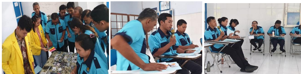
Gambar 5,6,7. Peserta Memilih Gambar, Menempelkan pada Kertas, Memberi Makna, dan Sharing.

Pada pelaksanaan kegiatan pelatihan diawali dengan game memilih gambar yang disukai. Fasilitator memberikan banyak gambar dan meminta peserta untuk memilih gambar yang disukai. Setelah itu, para peserta diminta mengamati gambar pilihannya. Game memilih gambar ini untuk menyiapkan peserta memasuki materi “Karier dan Misi”.