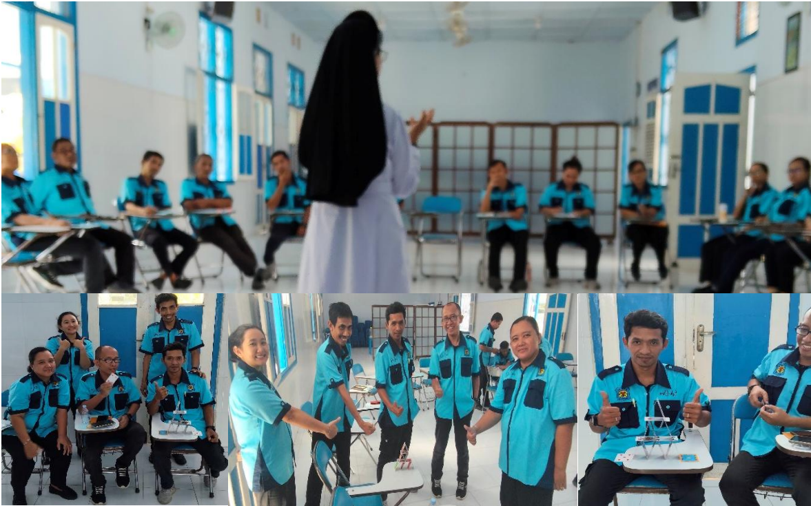
Gambar 8,9,10,11. Di dalam Kelompok Peserta Melaksanakan Permainan Menyusun Kartu Menjadi Bangunan.

Evaluasi kegiatan dilaksanakan melalui survei kuesioner yang diberikan kepada para peserta. Dari analisis evaluasi ditemukan sebanyak 95% pendidik dan tenaga kependidikan SMPK Yoga Blitar telah memahami dan hafat nilai-nilai SYPG. Seluruh pendidik dan tenaga kependidikan SMPK Yoga Blitar memaknai pekerjaan sebagai panggilan. Makna bekerja bukan semata-mata demi uang atau penghasilan. Pada kenyataannya, hidup memerlukan uang. Uang merupakan salah satu berkat Tuhan yang dapat diusakan melalui berbagai cara. Sebagai pribadi beriman dan bersemangat SYGP maka senantiasa percaya bahwa Tuhan menyelenggarakan hidupnya, memelihara, dan memenuhi sukacita.